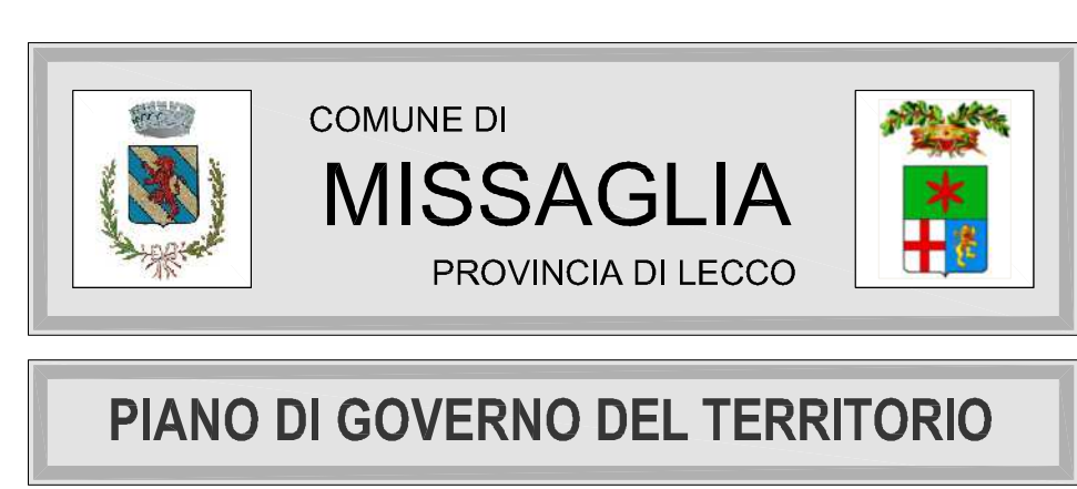
tavola 3b CARTA DEL CONSUMO DI SUOLO Elementi di stato di fatto e di diritto vigenti al 02.12.2014 (L.R. 31/2014) scala 1:5.000

NUOVO DOCUMENTO DI PIANO E VARIANTE AL PIANO DEI SERVIZI E PIANO DELLE REGOLE IN ADESIONE ALLA L.R. 31/2014 adozione delibera C.C. n° del 2021 approvazione delibera C.C. n° del 2021